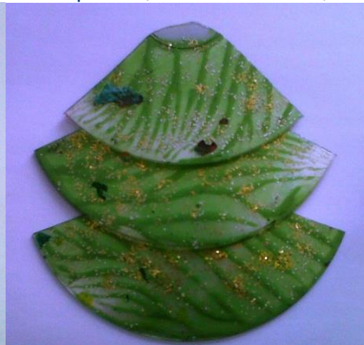
sapin réalisé avec un CD