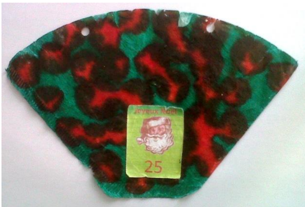
Encre Multidéco appliquée sur un filtre à café. Graphicol pour vernir et plastifier.