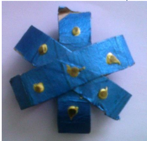
Rouleau en carton

Enfin, on peut aussi utiliser la Graphicol pour réaliser des travaux d'inclusions ou comme technique du déco-patch (utilisation diluée).