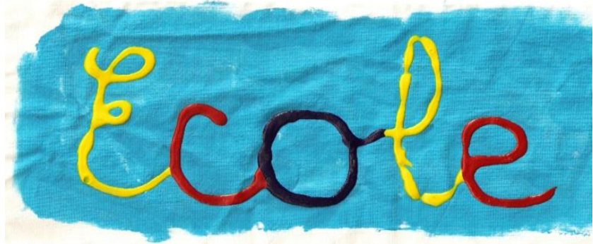
Relief des lettres obtenu en utilisant l'Odi'Laq en burette.

Épaisse et onctueuse, il est aussi possible de l'utiliser comme peinture à tissu. Après avoir fixé les couleurs (au dos) à l'aide d'un fer à repasser, les impressions résisteront au lavage à 30°.